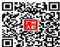
广州人社官方微信

温馨提示： 本宣传资料内容如果与政策文件有出入或政策发生调整，请以最新公布的政策为准。