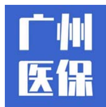
广州医保官方微信