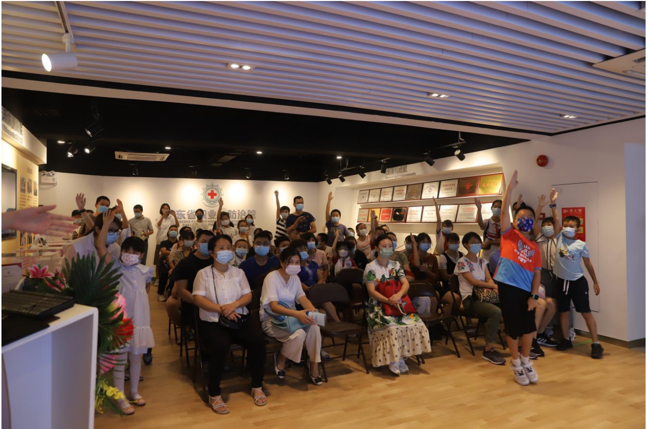
职业健康知识抢答环节