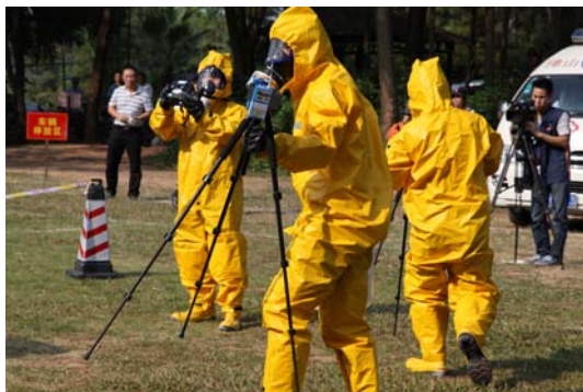
化学物采样和检测

职业卫生医师的任务则是第一时间赶赴事故现场，穿着符合相应标准的防护服进行化学物采样和检测、职业危病害因素的调查分析和协助医疗救援工作。