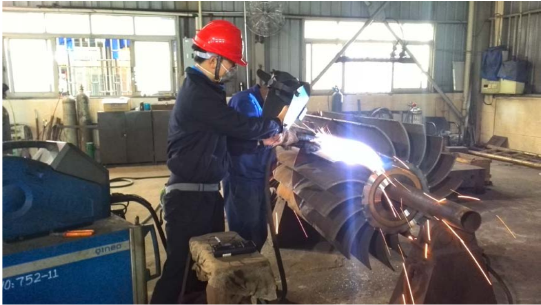
电焊弧光现场测量